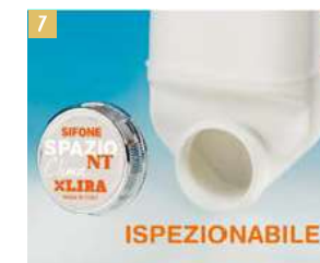
7. Il tappo di ispezione permette in un attimo di verificare l'eventuale presenza di detriti. Grazie alla conformazione del sifone, i corpi estranei si raccolgono proprio dietro il tappo.