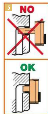
5. Per essere veramente salvaspazio, il sifone deve aderire completamente alla parete di fondo. Attenzione: il tubo di uscita deve essere tagliato della giusta misura: se troppo lungo potrebbe limitare il deflusso dell'acqua.