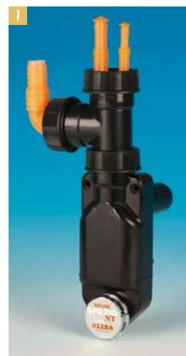
1. Come nella foto di apertura, il sifone Spazio NT Clima (qui in versione di colore nero) presenta l'allestimento completo di TEE aggiuntivo per la raccolta dello scarico di lavatrici o lavastoviglie.

Il contenuto della confezione mette in evidenza la grande versatilità del sifone Spazio NT Clima: oltre ai raccordi e ai tappi per far fronte a tutte le possibili combinazioni, è presente anche il TEE aggiuntivo per l'innesto di scarichi di lavatrici e lavastoviglie.