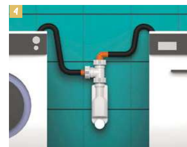
4. Spazio NT Clima può essere utilizzato anche per ricevere contemporaneamente lo scarico di una lavatrice e una lavastoviglie, usando i raccordi grandi montati sui due ingressi (superiore e laterale) del TEE aggiuntivo.