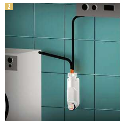
2, 3. Senza montare il TEE aggiuntivo, il sifone può comunque raccogliere lo scarico di due dispositivi tramite i due raccordi presenti sul tappo superiore.