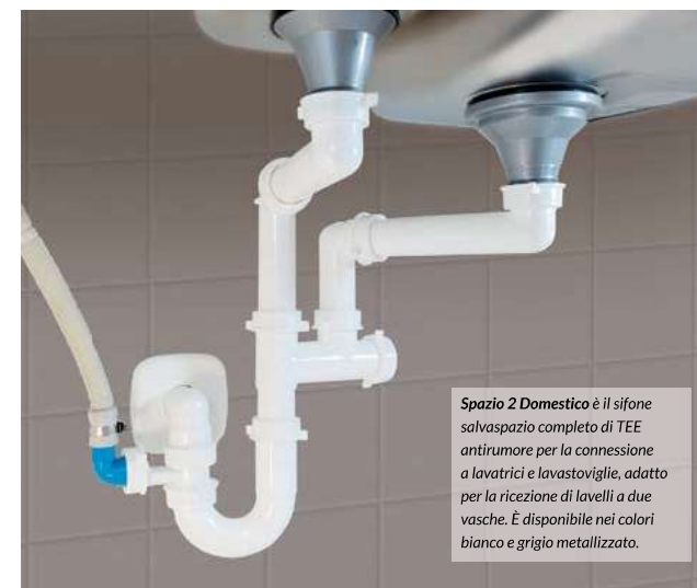
Spazio 2 Domestico è il sifone salvaspazio completo di TEE antirumore per la connessione a lavatrici e lavastoviglie, adatto per la ricezione di lavelli a due vasche. È disponibile nei colori bianco e grigio metallizzato.

Tutti i prodotti Lira sono interamente realizzati in Italia, nello stabilimento di Valduggia, sede storica dell'azienda. Una realtà che unisce tradizione e innovazione e che proprio recentemente ha celebrato con orgoglio il centenario della sua fondazione, confermando un impegno costante nella qualità, nell'affidabilità e nella soddisfazione del cliente.